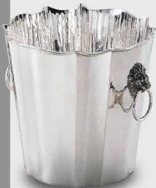
2052-Secchio champagne con leoni 2052-Ice bucket for champagne with lions