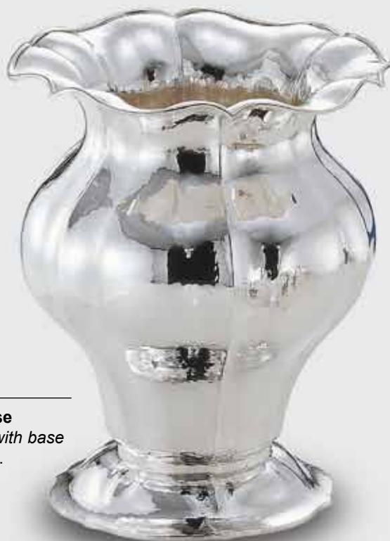
2054-Porta champagne con base 2054-Ice bucket for champagne with base