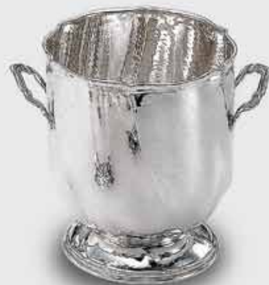
2051-Secchio ghiaccio torçon con base e manici 2051-Ice bucket with base and handles - spiral model