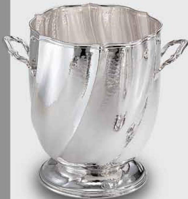
2050-Secchio champagne torçon con base e manici 2050-Ice bucket for champagne with base and handles spiral model