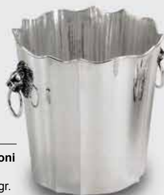
2053-Secchio ghiaccio con leoni 2053-Ice bucket with lions