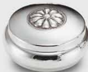
1665-Scatola rotonda "Margherita" 1665-Round box - "Margherita" Art. code Mis. cm. size Peso gr. weight 1665 13,5 200