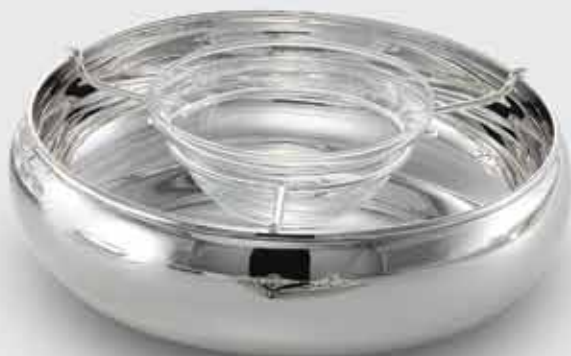
1704-Ciotola rotonda servire caviale