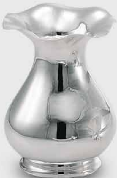
1683-Vaso alto liscio 1683-Smooth high vase