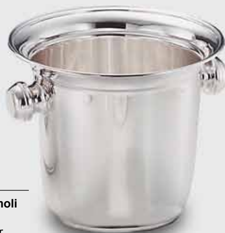
1615-Secchio ghiaccio con pomoli 1615-Ice bucket with handles