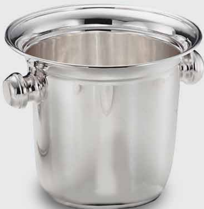
1614-Secchio spumante con pomoli 1614-Ice bucket for sparkling wine with handles