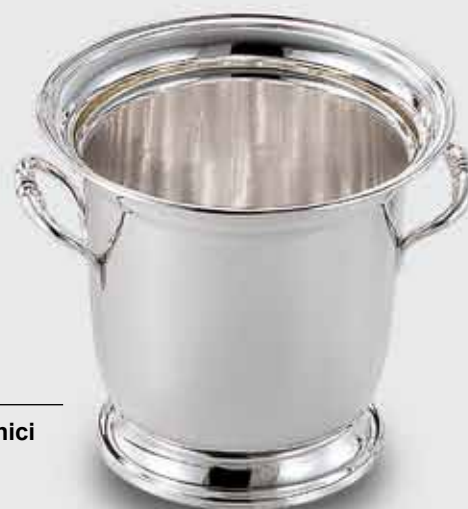
1617-Secchio ghiaccio con base e manici 1617-Ice bucket with base and handles