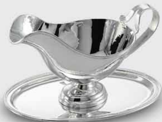
1695-Salsiera Inglese liscia con base e piatto

1695-Smooth sauce boat with base and tray