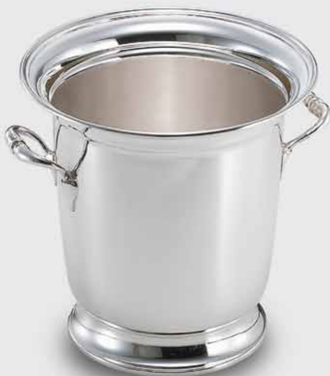
1616-Secchio spumante con base e manici 1616-Ice bucket for sparkling wine with base and handles