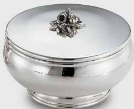
1666-Scatola rotonda liscia con base 1666-Smooth round box with base Art. code Mis. cm. size Peso gr. weight 1666 Ø 17 h. 11 470