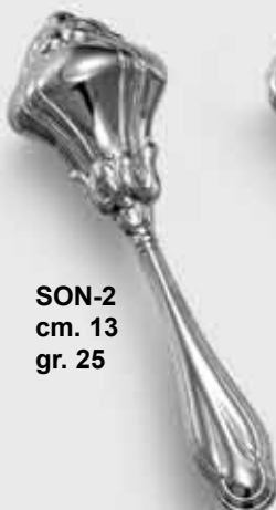
SON-2 cm. 13 gr. 25