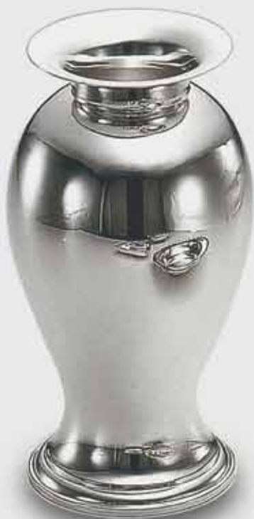
1661-Vaso "Spagnolo" liscio 1661-Smooth vase - "Spagnolo" Art. code Mis. cm. size Peso gr. weight 1661 h. 28 720