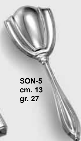
SON-5 cm. 13 gr. 27