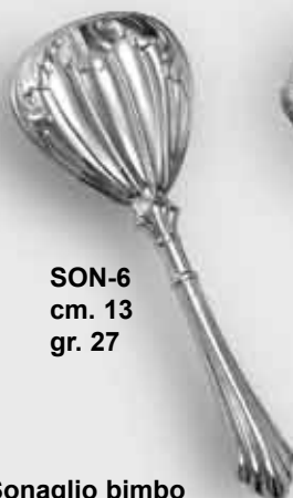
SON-6 cm. 13 gr. 27