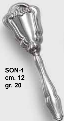
SON-1 cm. 12 gr. 20