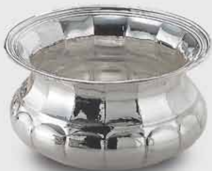
1664-Cache-pot antico cesellato 1664-Old-style chiselled cache-pot Art. code Mis. cm. size Peso gr. weight 1664 h. 10,5 650