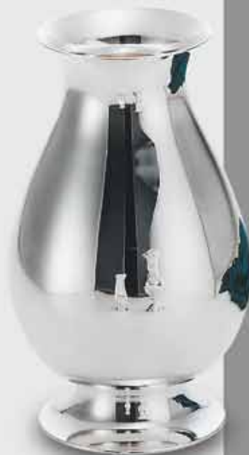
1663-Vaso liscio battuto con base 1663-Smooth hammered vase with base Art. code Mis. cm. size Peso gr. weight 1663/19 h. 19 410 1663/27 h. 27 710 1663/31 h. 31,5 1170