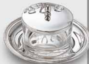
1527-Formaggera rotonda 1527-Round grated cheese bowl Art. Descrizione Mis. cm. code description size 1527 15 1527/C cucchiaio formaggio 1527/C spoon 1527/1 cristallo per formaggera 1527/1 crystal glass container