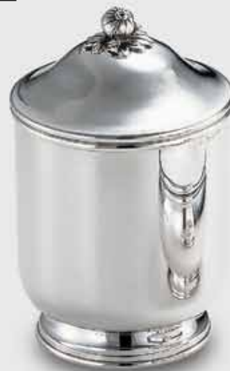
1667-Scatola cilindrica liscia con base 1667-Smooth cylindrical box with base Art. code Mis. cm. size Peso gr. weight 1667 Ø 12 h. 19 440