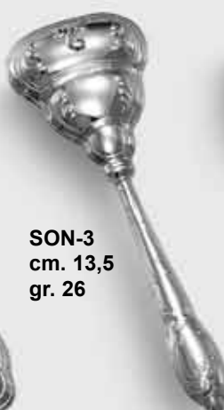
SON-3 cm. 13,5 gr. 26