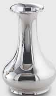
1662-Vasetto cipolla liscio 1662-Smooth small pot-bellied vase Art. code Mis. cm. size Peso gr. weight 1662/11 h. 11,5 120 1662/13 h. 13,5 160 1662/15 h. 15,5 210