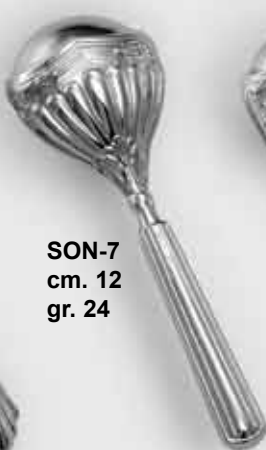
SON-7 cm. 12 gr. 24