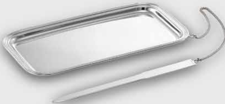
1684-Vassoietto rettangolare inglese con tagliacarta

1684-Small rectangular tray with paper knife