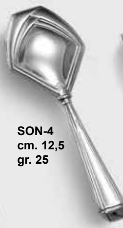
SON-4 cm. 12,5 gr. 25