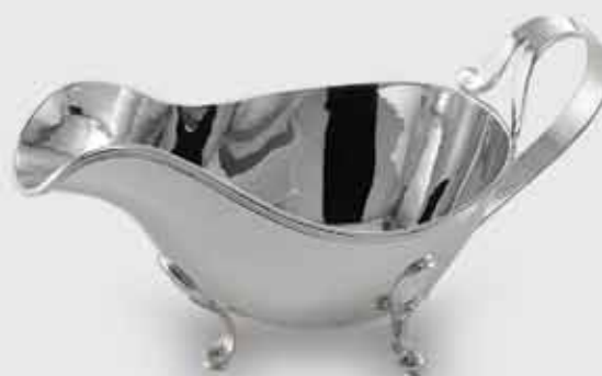
1695/Z-Salsiera Inglese liscia con zampe