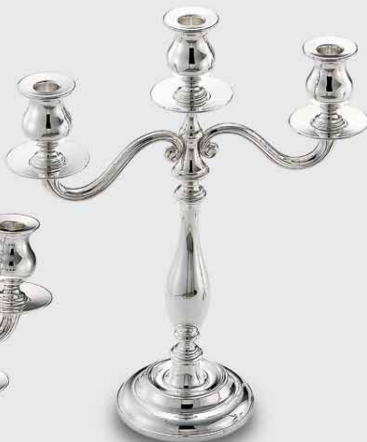
1596-Candelabro "Windsor" maxi 3 fiamme 1596-High candlestick (3 candles) - "Windsor" - Large Art. Mis. cm. Peso gr. code size weight 1596 h. 38,5 700