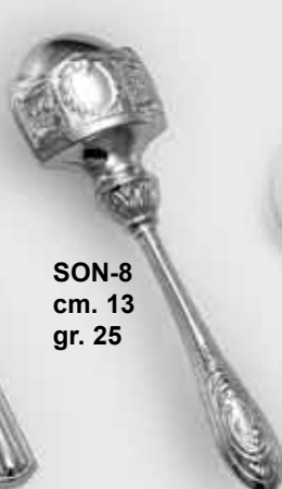
SON-8 cm. 13 gr. 25